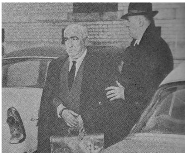
Vilhelm Rajh – kadar iz filma WR Misterije organizma

Poseban tzv. drugi međusloj kod čoveka čine „agresivni, zločinački, anarhični impulsi nastali transformacijom i blokiranjem, kočenjem seksualnih i stvaralačkih impulsa“ 5 . Kada dođe do eksplozije ljudskih energija dolazi do oslobađanja ovog sloja i tada dolazi do zločinačkih akcija, ratova i samoubistava, a kada eksplozije ovih energija oslobode čovekovo