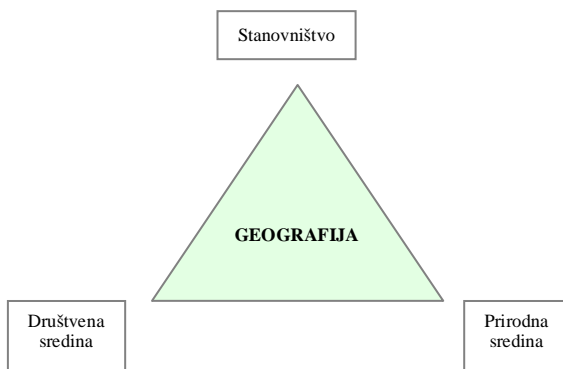
Shema 1. Konceptualizacija mesta geografije stanovništva u sistemu geografske nauke prema G. Trewarti

fenomenima. U svom modelu on predlaže podelu geografije na stanovništvo, prirodnu sredinu i društvenu (kulturnu) sredinu, pri čemu je prirodnu i društvenu sredinu postavio kao bazu, dok je stanovništvo stavio na vrh piramide datog modela (shema 1, Trewarta, 1953).