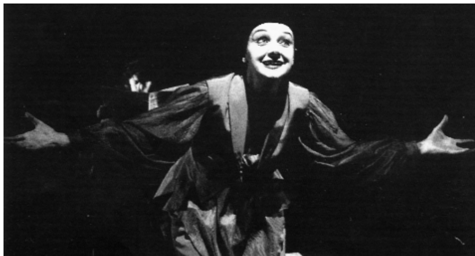
„Ravnodušni lepotan” Ž. Koktoa

sve dok nije videla Felinijevu Ulicu i shvatila da je gluma njena najdublja vokacija. Igrala je u Felinijevim filmovima – Iskušenje dr Antonija , Bokačo '70 , Đulijeta od duhova , Tri koraka u deliriju , Amarkord , – i sa Mazinom postaje nerazdvojan saradnik, a to divno prijateljstvo trajalo je sve do rediteljeve smrti.