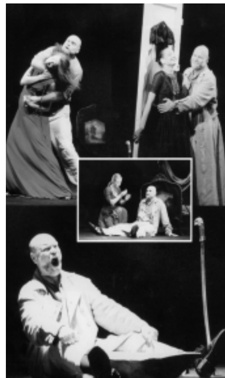
„ Otelo ”, ftohronika Tomazo le Pera

stvara se tkanje za pripremu komada na sceni. U svojoj nutrini likovi delaju kao nezavisni od volje, potpuno poništeni, zaobljenici jednog gvođenog rituala. Radnje Otela , Jaga , Dezdemone slede zavere neizbežne sudbine koja ostavlja mesta samo za sažaljenje. Upravo je sažaljenje to što podstakne Otela da zagrlji Dezdemonu i grleći je neprestano istovremeno ubija. Sve tri Šekspirove drame u režiji Eimuntasa Nekrošiusa igrane su letos na Festivalu u Parmu.