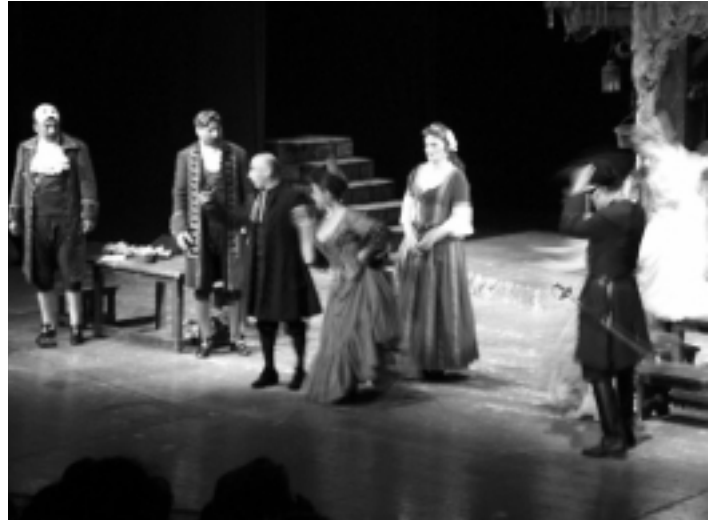
Бетула у Малу Валу