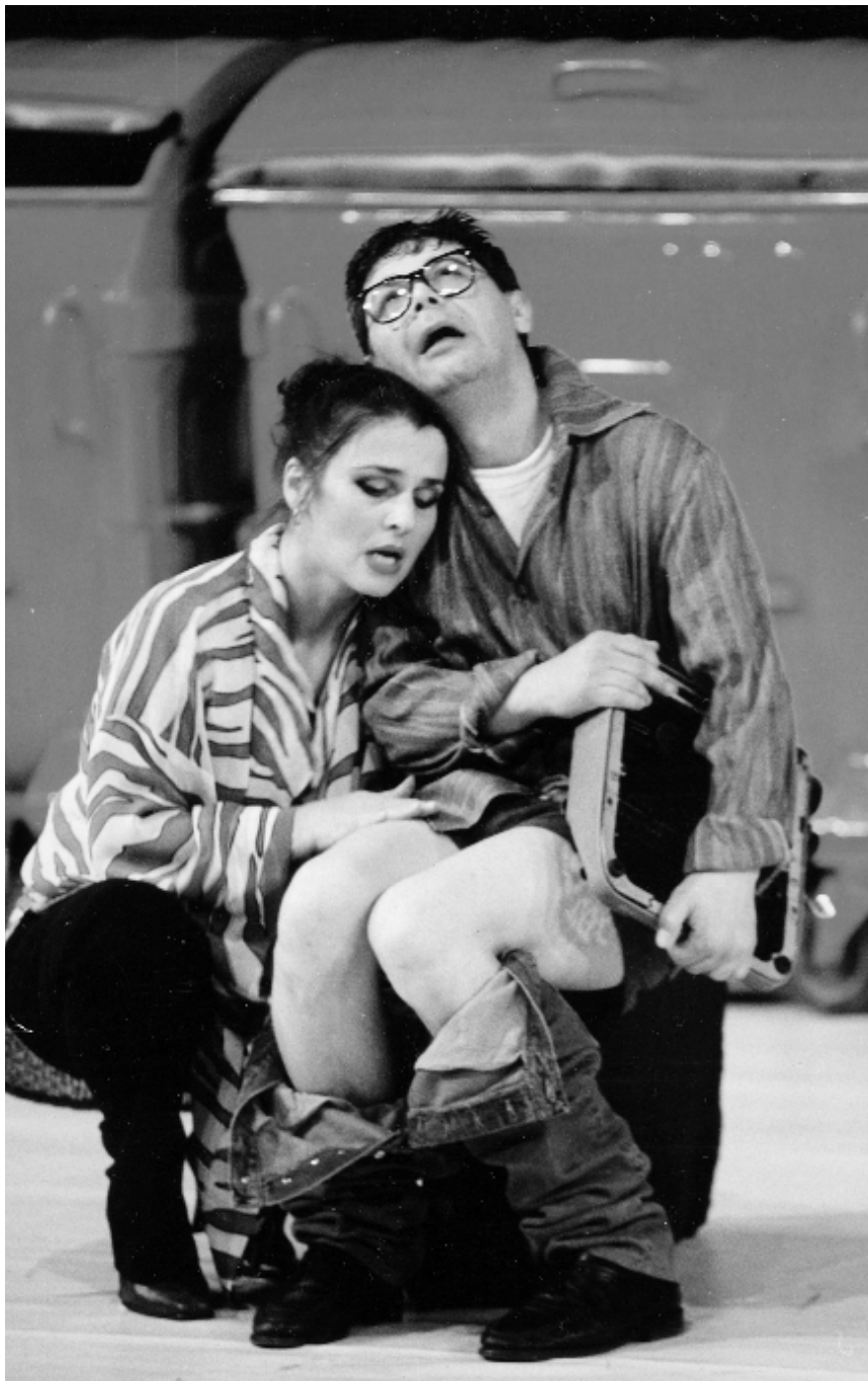
Cuba libre.

1. CUBA LIBRE Ивана М. Лалића, у режији Кокана Младеновића, Српско народно позориште, Нови Сад. Лалићева и нежна и сурова комедија и Младеновићева маштовита режија на смео начин покушавају да сагледају свет у којем, за сада, живимо.