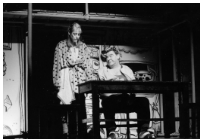
Павиљони.