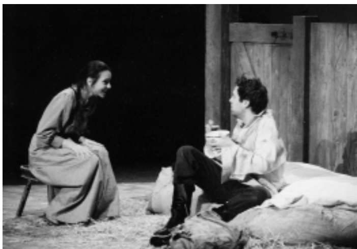
Право на Руса.