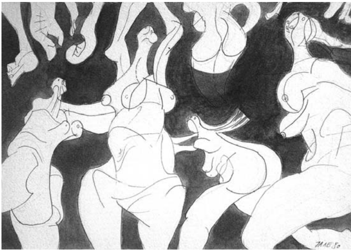
Ljubodrag Janković, Kupačica, 1980, akvarel, tuš, pero, 25 x 35 cm

Ljubodrag Janković Jale nije bio član Medijale. Ideje ovog kruga, međutim, bile su mu veoma bliske. Smatra da je Medijala značajno doprinela da se uspostavi ravnoteža između apstraktnog i figurativnog slikarstva.