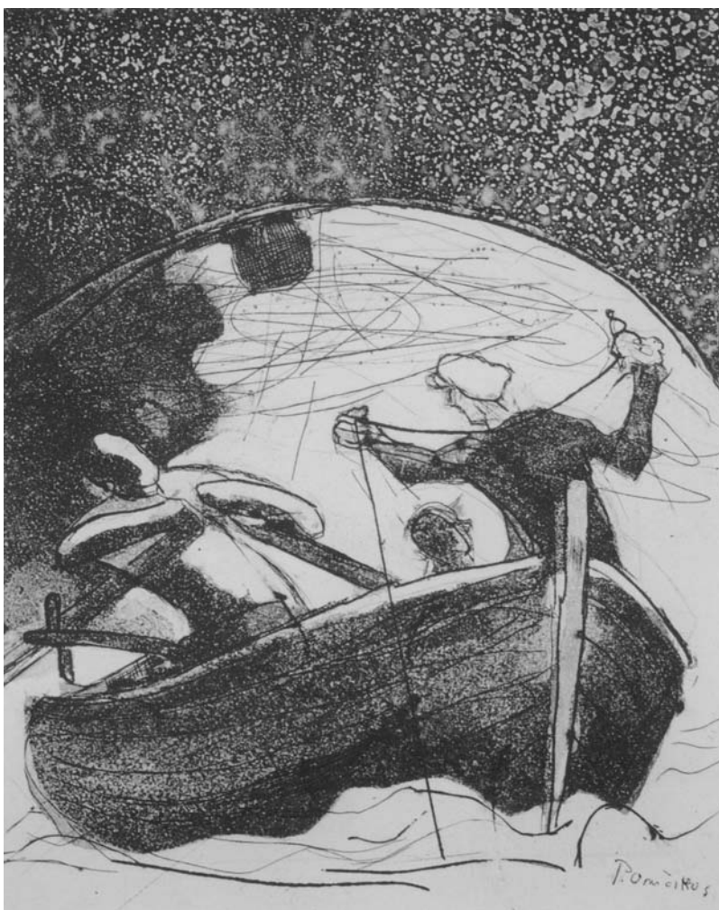
PETAR OMČIKUS, Iz mape SOL