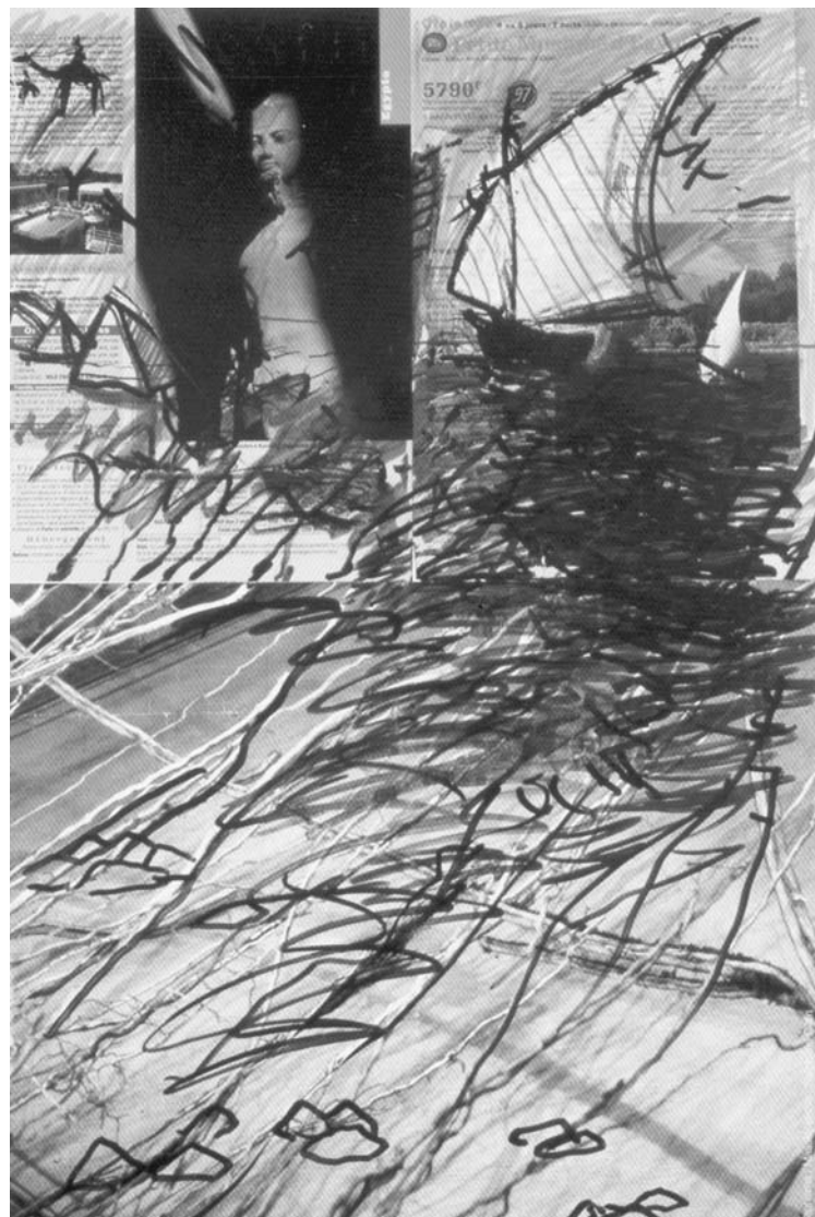
BOGDAN PAVLOVIĆ, Crtež