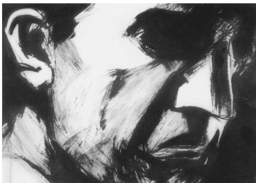
BOJAN OTAŠEVIĆ, Spot , algrafija, 2003, 100x70cm.