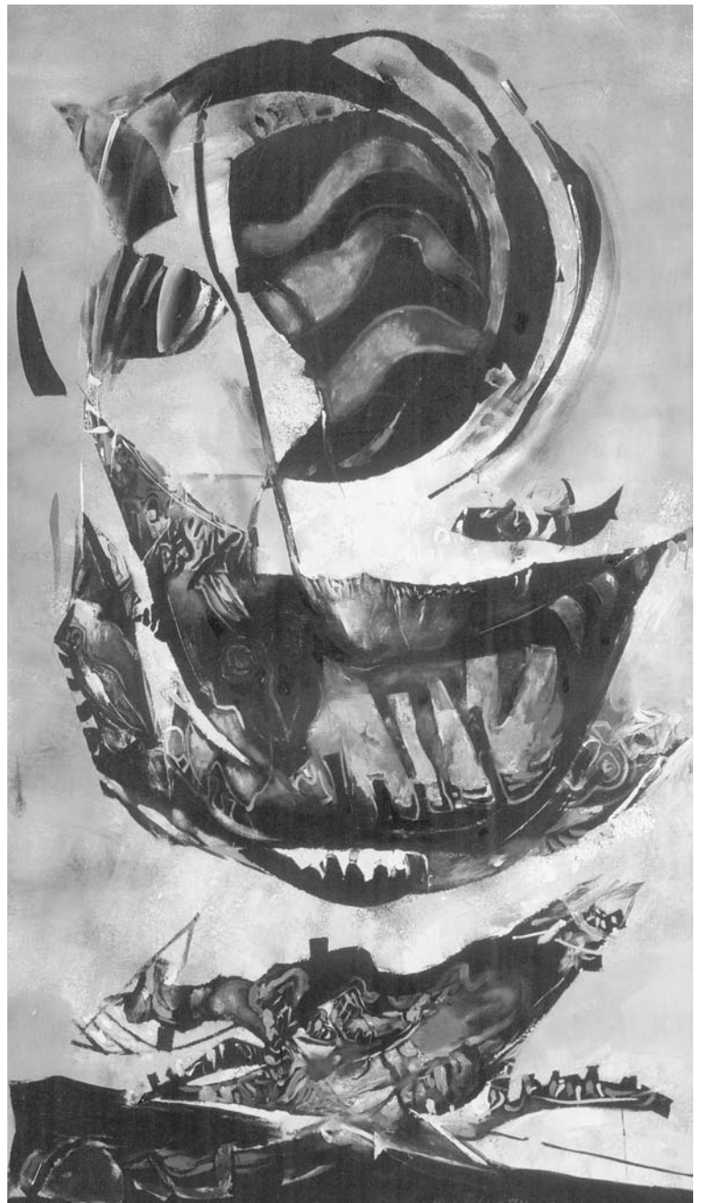
MILORAD BATA MIHAJLOVIĆ