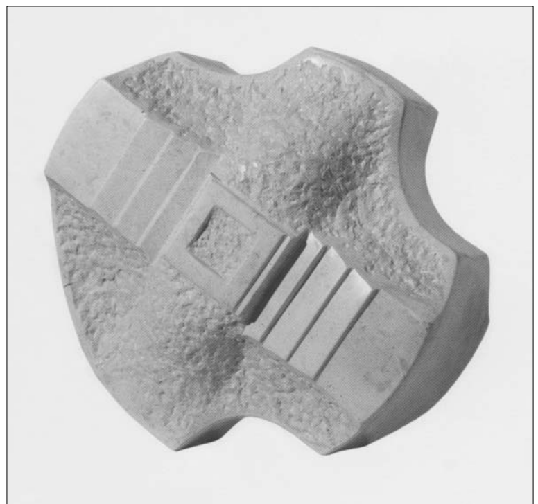
RADOMIR BRANISAVLJEVIĆ, Točak vremena, 2003, kamen, 12x40x40cm