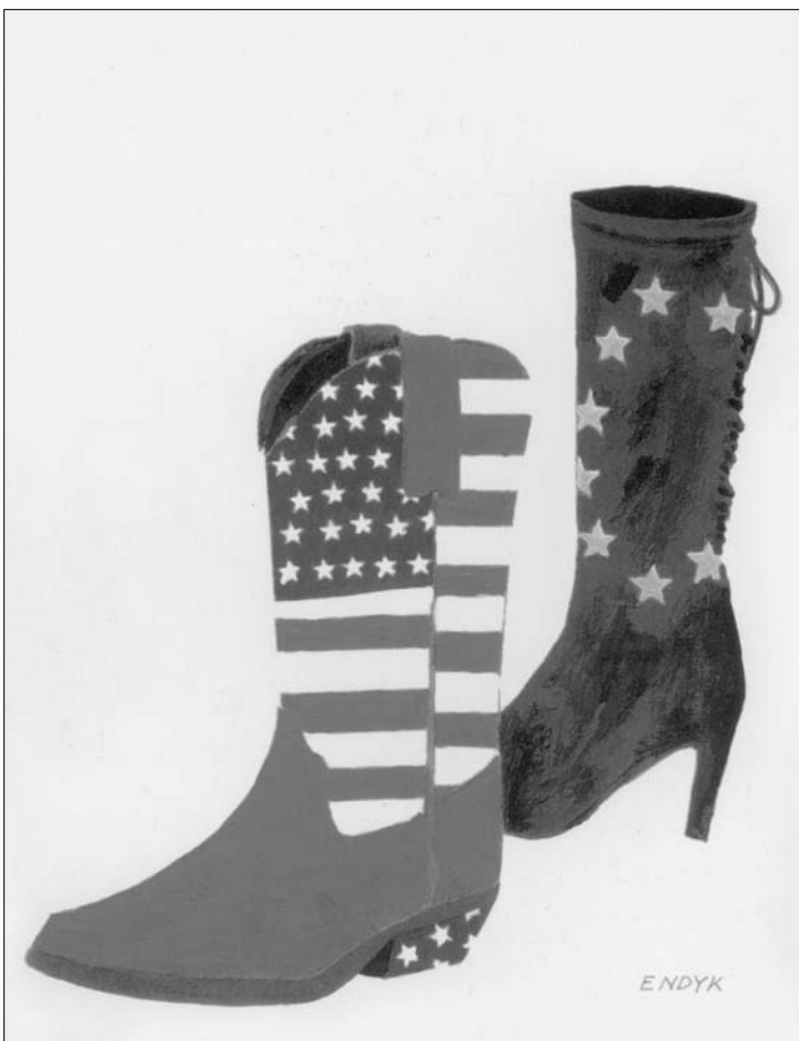
PRVA NAGRADA PETER NIUWENDIJK, Holandija, Američka grubost – Evropska elegancija Deseti Međunarodni salon karikature Zemun 2005.