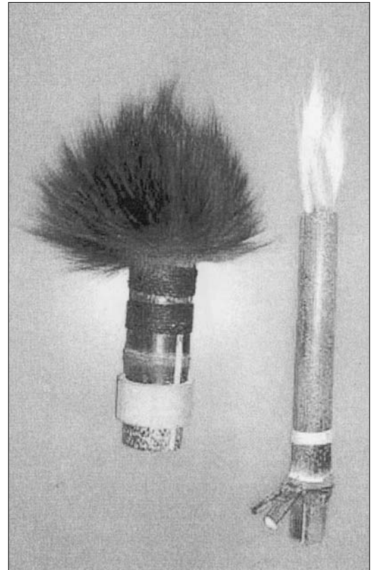
SNEŽANA PETROVIĆ, Brushes Skulptura – Objekat ili gde je Granica