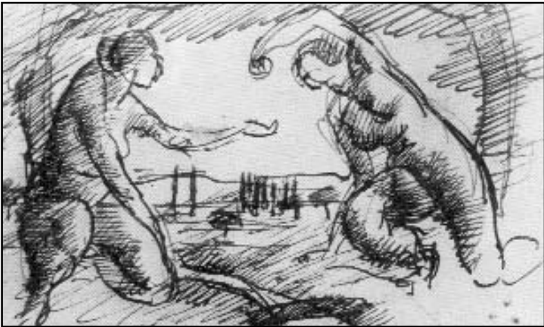
Ivan Radović – Dve žene sa jabukom, 1919.

Obrana demokratije mora dakle biti povedena na zdravoj, etičkoj, i jedino mogućoj osnovi, na kojoj ona ima i svu trajnost jednog političkog sistema opšte vrednosti i svu praktičnu vrednost za budućnost čovečanstva.*